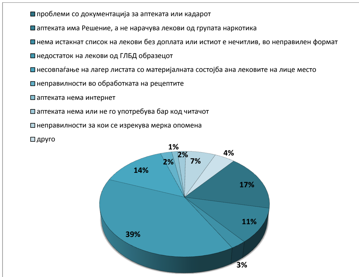
Графикон 4: Констатирани неправилности во работењето на ПЗУ аптеките

Фондот за здравствено осигурување на Македонија продолжува и понатаму со активности за максимално обезбедување на нашите осигуреници со квалитетни здравствени услуги на товар на ФЗОМ во рамки на определените финансиски ресурси, во кои спаѓа и обезбедувањето со лекови на рецепт од Листата на лекови на товар на Фондот во примарната здравствена заштита. По констатираните неусогласености на работењето на аптеките утврдени преку контролите, ФЗОМ превзема мерки соодветно, како што е редовна комуникација со аптеките и работилници за стручниот кадар.